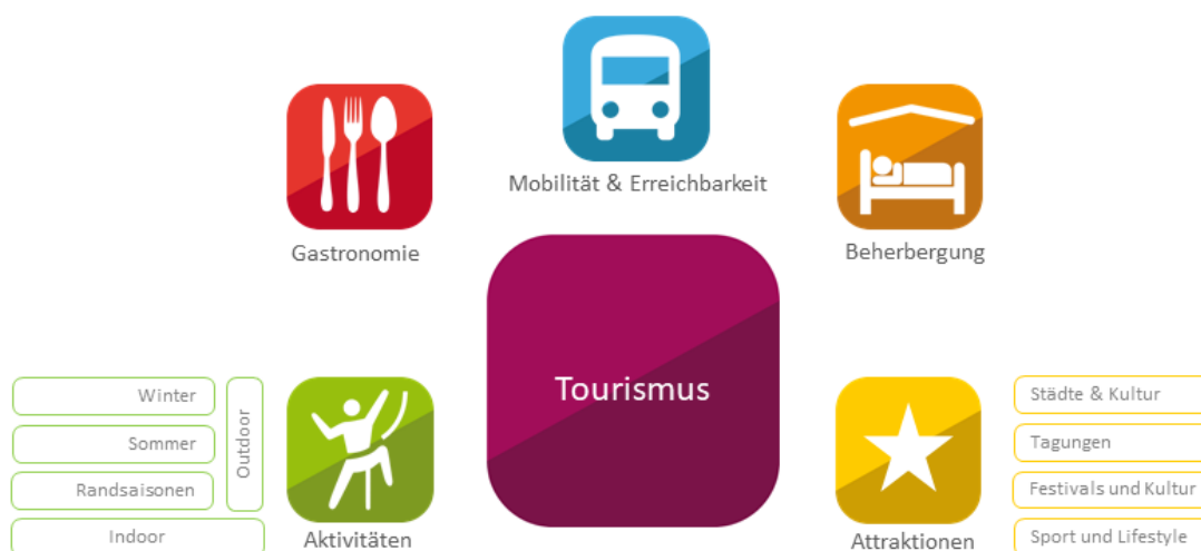
Abbildung 1 Wesentliche Komponenten eines touristischen Angebots.

Viele Bereiche der Landnutzung, wie etwa die Land- und Forstwirtschaft, sind von den Auswirkungen des Klimawandels betroffen. Der Tourismus unterscheidet sich von diesen betroffenen Bereichen ganz wesentlich. Zum einen setzt sich ein touristisches Angebot grundsätzlich aus verschiedenen Komponenten zusammen, die von verschiedenen Anbietern kommen und die in Österreich, anders als vielfach in Nordamerika, meist völlig unabhängig voneinander entwickelt und angeboten werden. Abbildung 1 gibt einen Überblick über diese Komponenten. Zum anderen unterscheiden sich die Verhältnisse gegenüber anderen Landnutzungen auch dadurch, dass der Tourismus von der Wahrnehmung der Urlaubsregion durch den Gast und dessen Entscheidung abhängig ist (vgl. Abb.2).